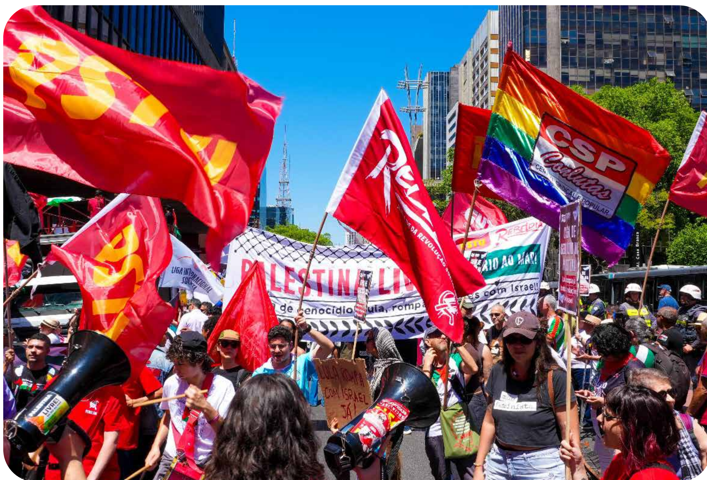
Ato em São Paulo pela Palestina Livre

busca de tutela estrangeira de Gaza por assassinos, sionistas e bilionários, além do desarmamento do Hamas – está na primeira fase de troca de prisioneiros. O cenário é de incerteza.