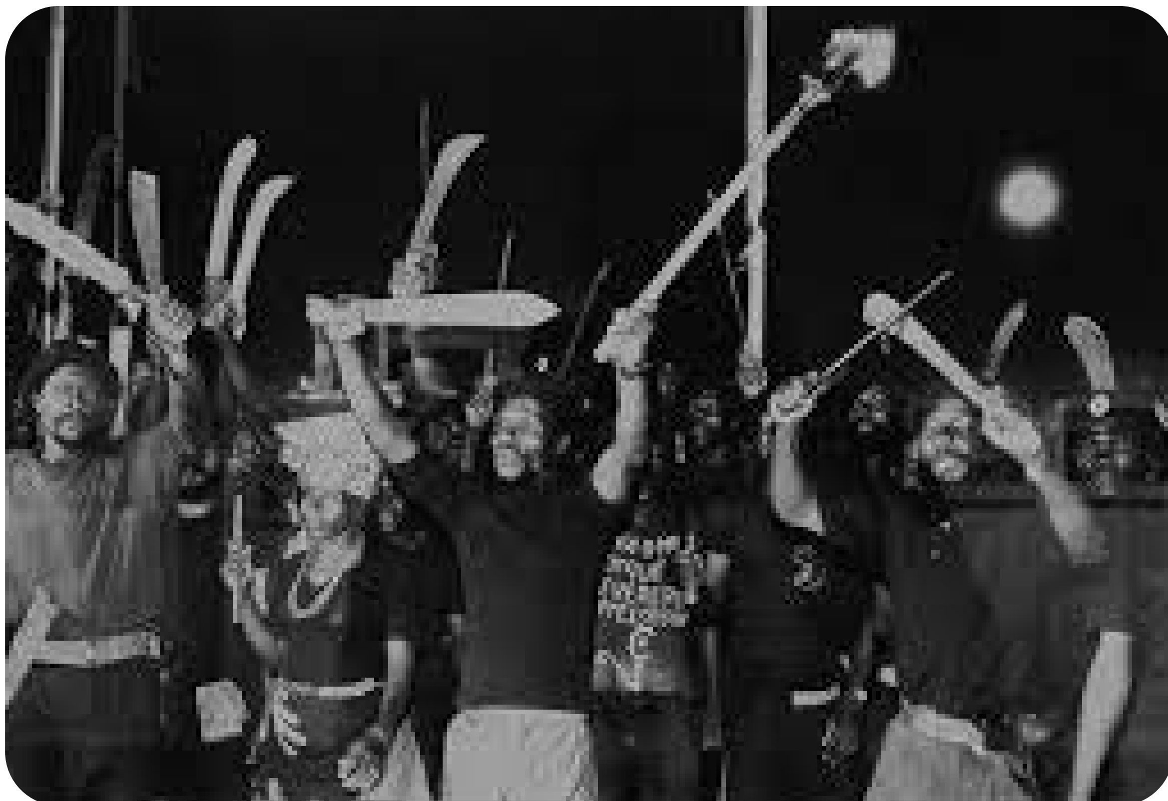
Lutas e resistência popular. | Foto: reprodução

Nas comemorações dos 50 anos da independência de Angola organizadas pelo