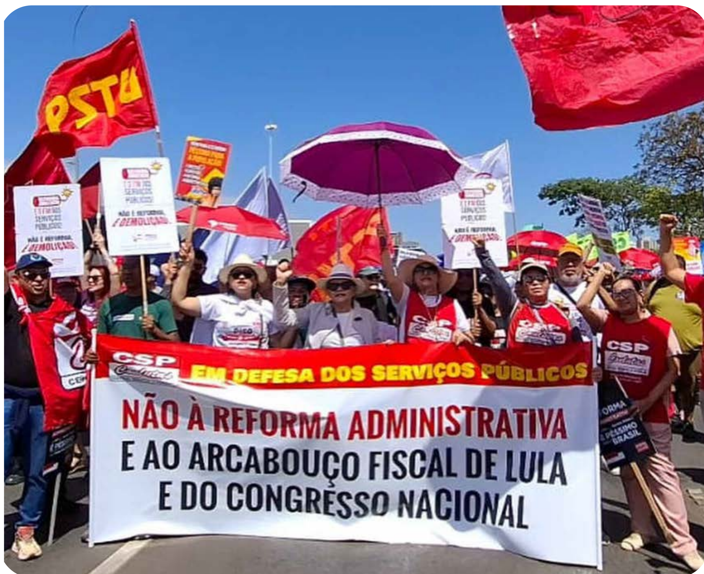
Marcha dos Servidores, em Brasília - DF

No dia 29 de outubro, trabalhadores e trabalhadoras do serviço público das três esferas realizaram um importante processo de mobilização no Distrito Federal contra a reforma administrativa. A marcha dos servidores contou com mais de 20 mil pessoas e demonstrou disposição de luta das categorias para derrotar a PEC 38/2025, protocolada alguns dias antes, depois que o deputado Pedro Paulo (PSD-RJ) conseguiu as 171 assinaturas necessárias para a proposta de emenda à Constituição.