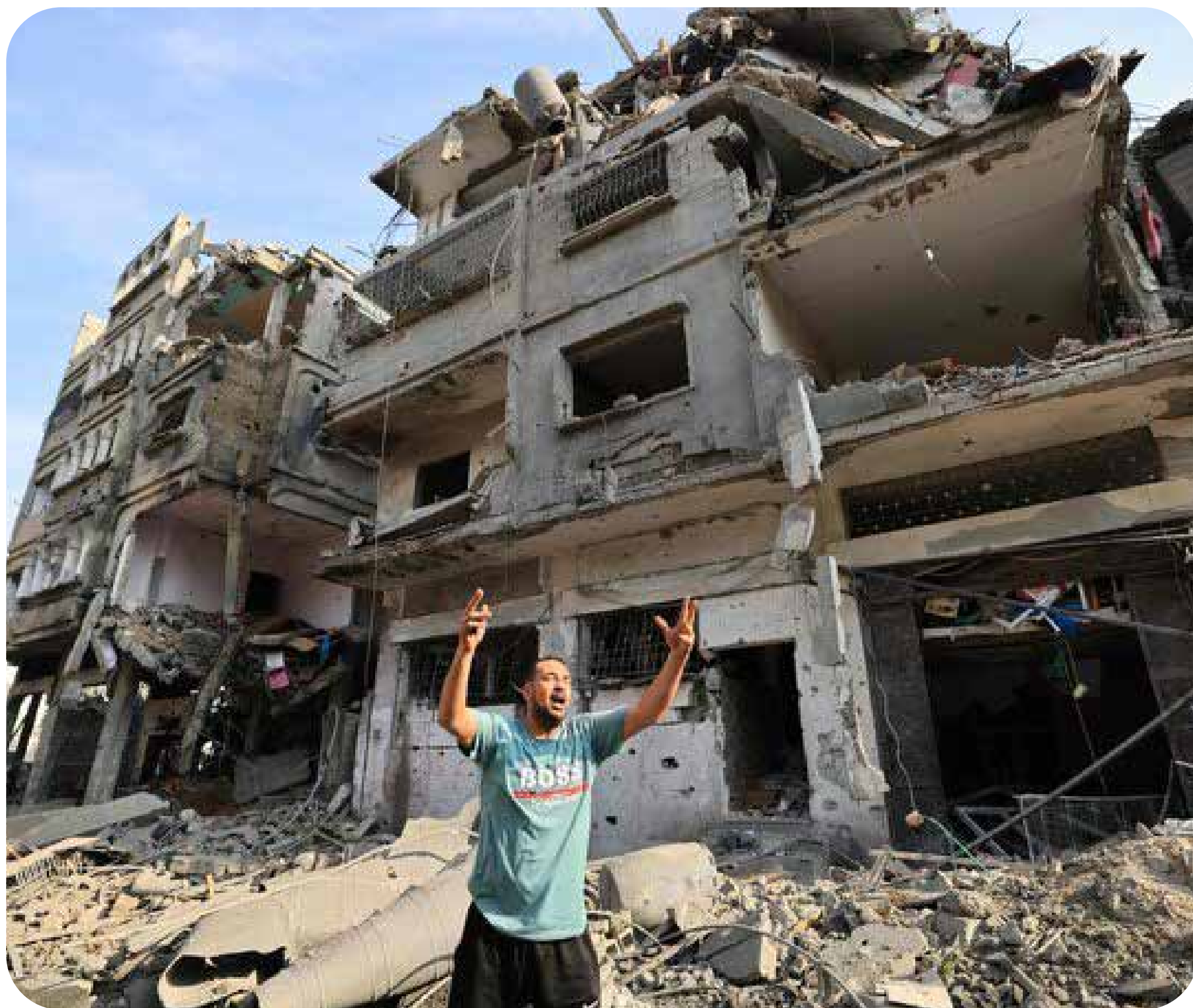
Destruição em Gaza provocada pelo Estado de Israel.

Dia 29 de novembro é o Dia Internacional de Solidariedade ao Povo Palestino, com atos em todo o mundo