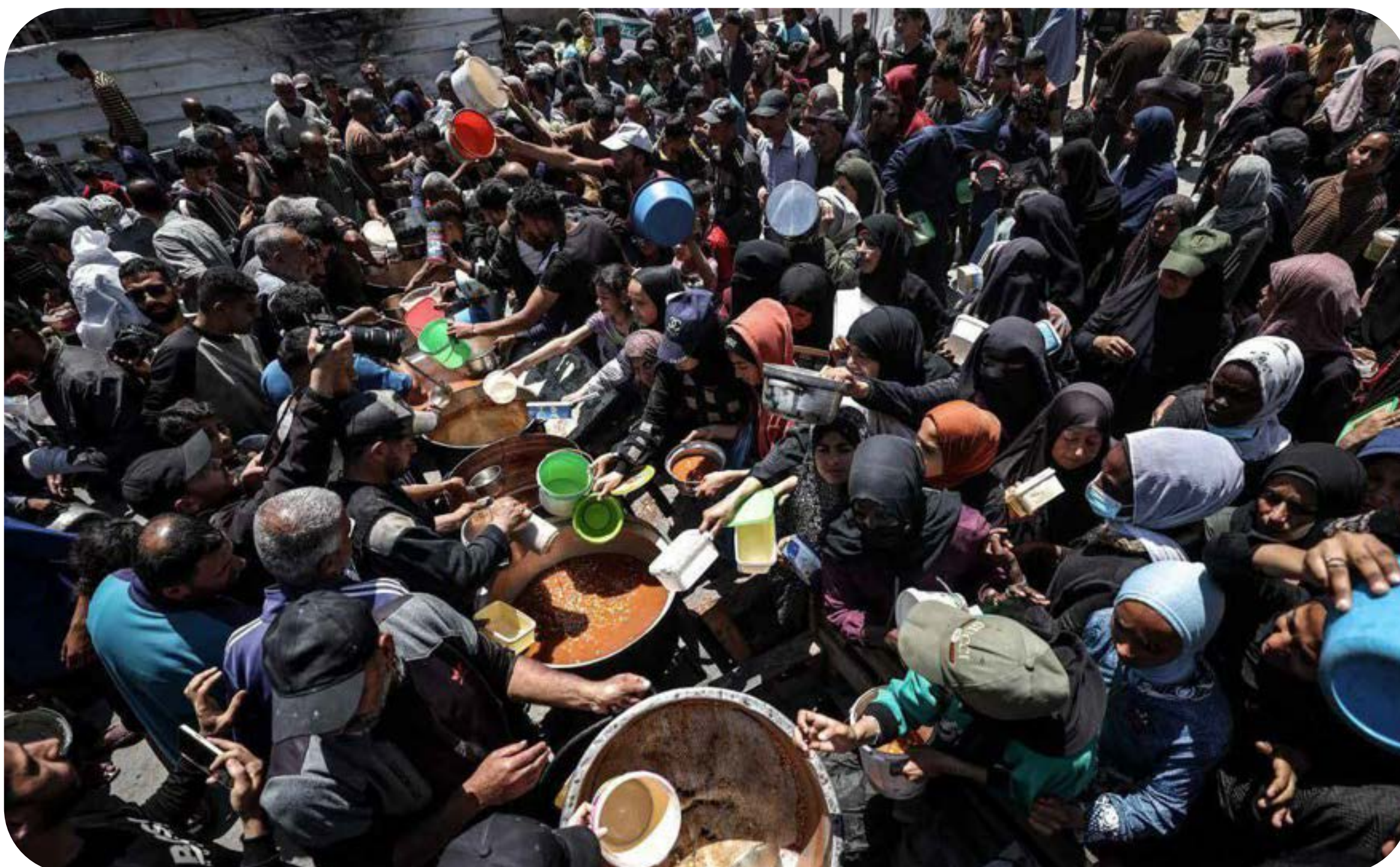
Fome se alastra por Gaza com cerco sionista.

A fome, imposta por Israel como arma a serviço do genocídio nos últimos dois anos, continua. Uma a cada cinco famílias faz apenas uma refeição por dia conforme a ONU, e 43% delas reduziram as porções servidas.