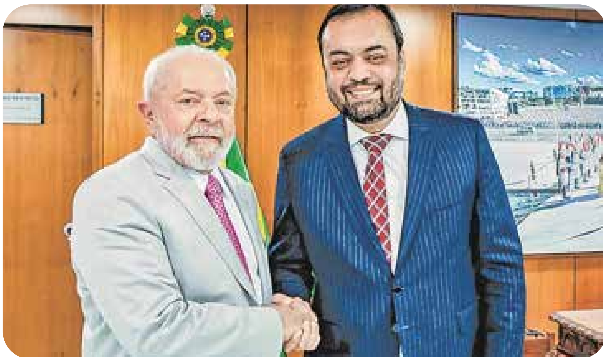
O presidente Lula e o governador do Rio de Janeiro, Cláudio Castro

As propostas têm uma importância estratégica para o PT. Pesquisa da Genial/Quaest, publicada em 8 de outubro, reafirmou que hoje a segurança é a principal preocupação dos brasileiros. Diante disso, com os olhos na eleição de 2026, o Governo Federal polariza com o bolsonarismo. Mas será que o caminho apontado indica soluções reais para o povo trabalhador, especialmente negros e negras?