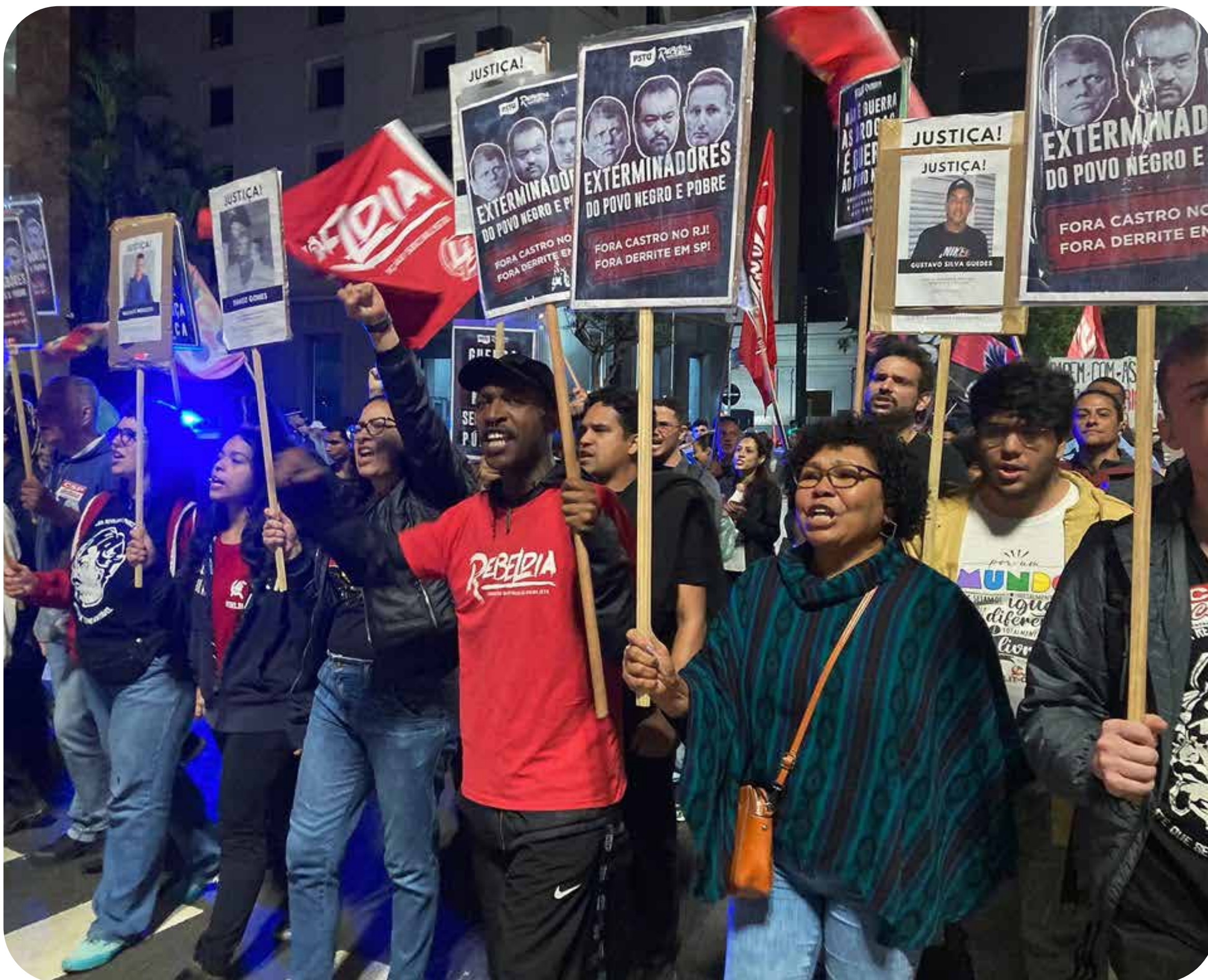
Protesto em São Paulo pelo Fora Castro e Derrite

A situação calamitosa da segurança pública no Brasil é um sintoma da falência completa do sistema capitalista. Por um lado, a extrema direita comemora a desastrosa ação da polícia no Rio de Janeiro como o suprassumo do combate ao crime organizado. O governo Lula, por sua vez, em palavras críticas à operação no Rio de Janeiro, chamando de matança, não diz que a Polícia Militar do estado da Bahia, governado há muito tempo pelo PT, é a polícia que mais mata no Brasil. Lula disse que não decretará a Garantia da Lei e da Ordem (GLO) no Rio de Janeiro, mas decretou a GLO em Belém durante a COP30.