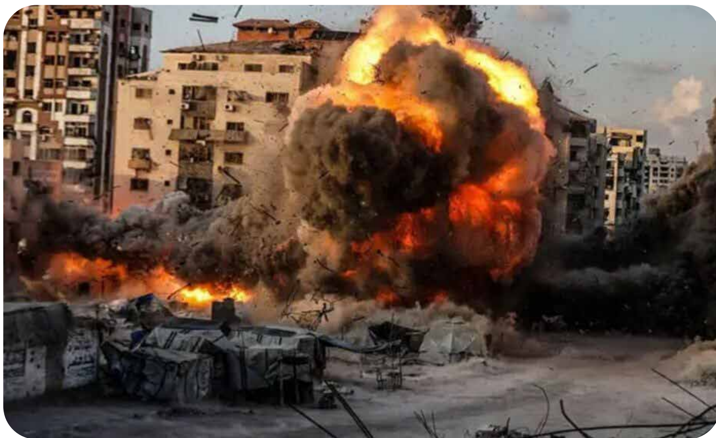
Ataque israelense sobre gaza.

“Você cessa, eu atiro.” Assim a relatora da Organização das Nações Unidas (ONU) para os territórios palestinos ocupados, Francesca Albanese, definiu o conceito de cessar-fogo no dicionário israelense, horas após seu anúncio, em 10 de outubro, quando o Estado sionista seguiu matando palestinos.