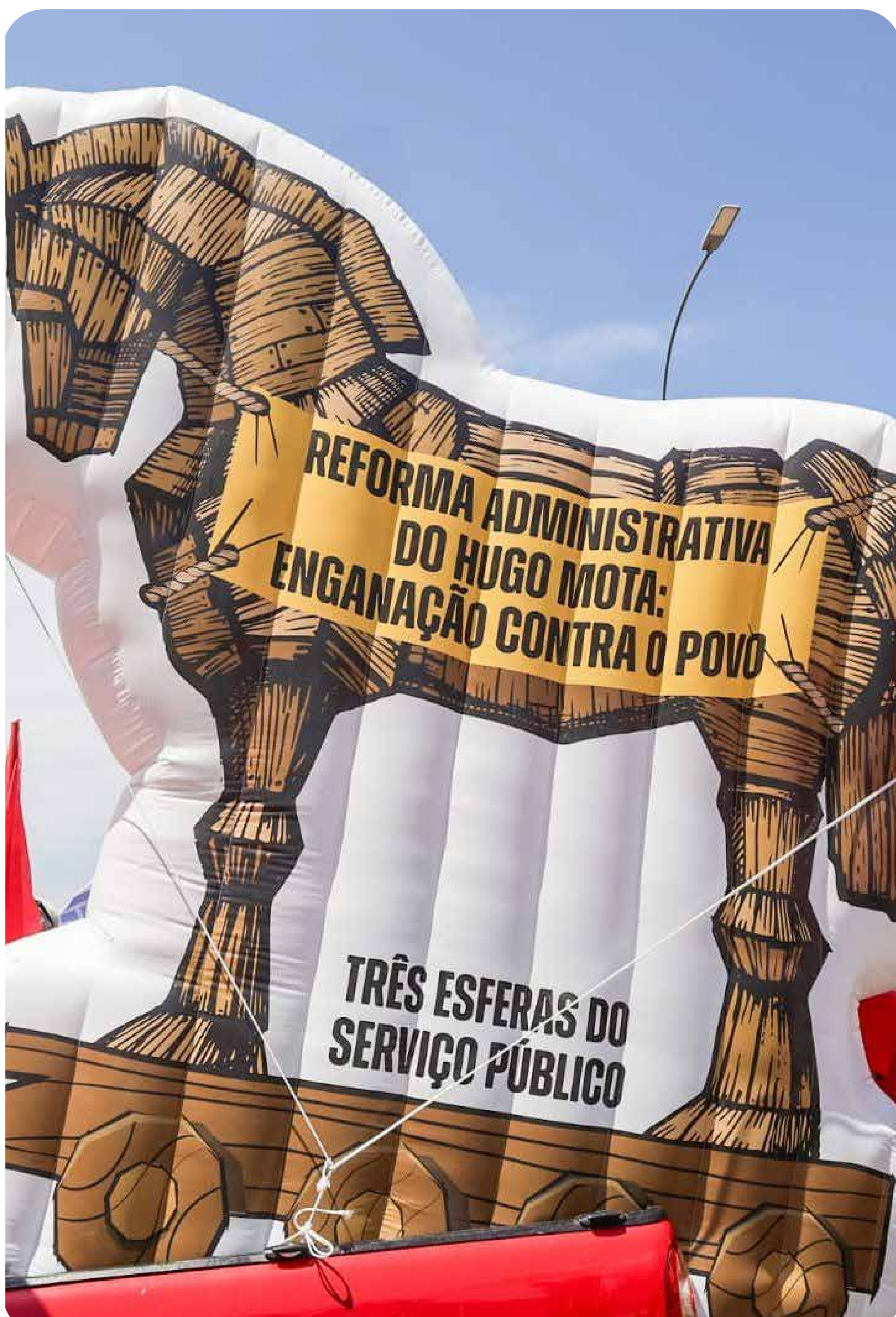
Marcha dos Servidores, em Brasília - DF

Além disso, também é preciso exigir de Lula que interrompa a reforma administrativa que está realizando no serviço público federal, revogando as medidas implementadas, e que se posicione de forma clara contra a aprovação da PEC 38/2025. ■