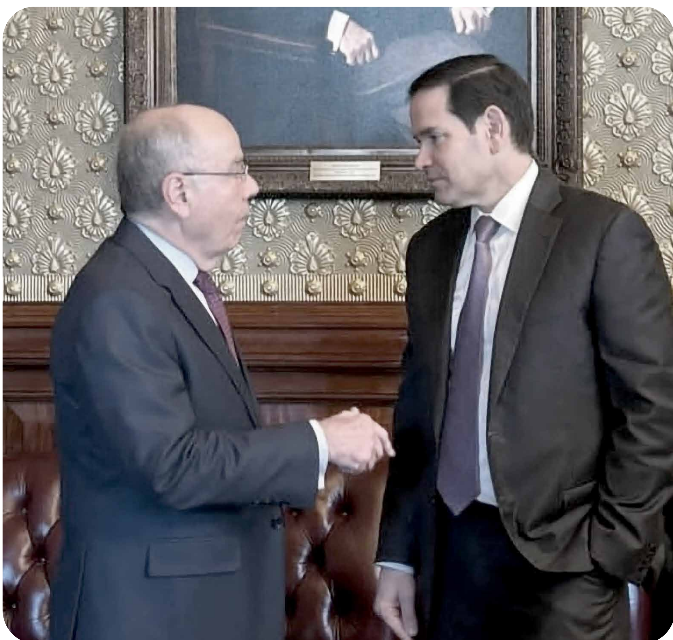
Encontro do ministro Mauro Vieira com o secretário Marco Rúbio, dos EUA.