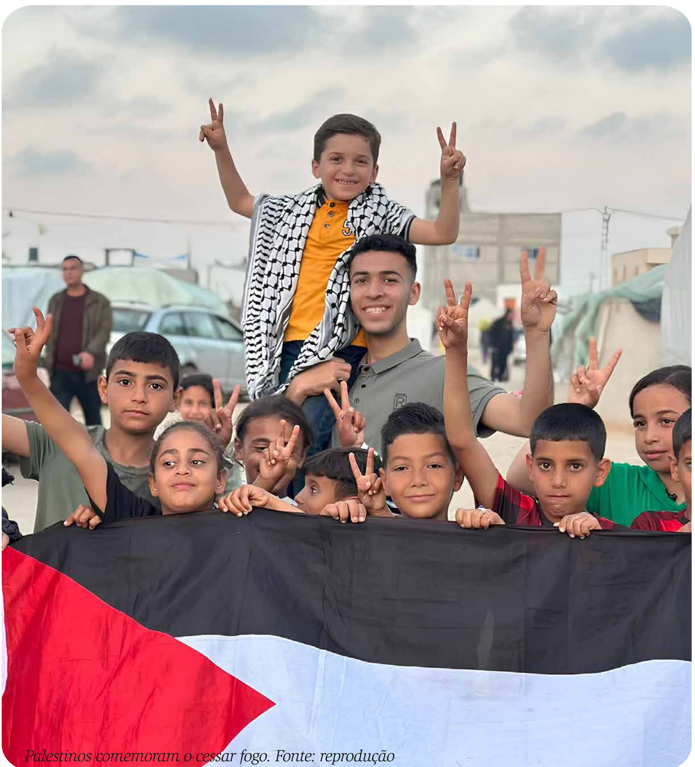
Palestinos comemoram o cessar fogo.

Mas Lula ainda tem a possibilidade de corrigir essa declaração equivocada. A relatora especial da ONU para os territórios palestinos ocupados, Francesca Albanese, fez um chamado a todos os países a cumprirem o direito internacional e aplicarem sanções contra o Estado de Israel por crime de genocídio. Essas sanções incluem o embargo militar e energético e o corte de relações diplomáticas. Mais que nunca é necessário que Lula rompa as relações com Israel e convoque todos os países a fazerem o mesmo, em solidariedade com o povo palestino. ■