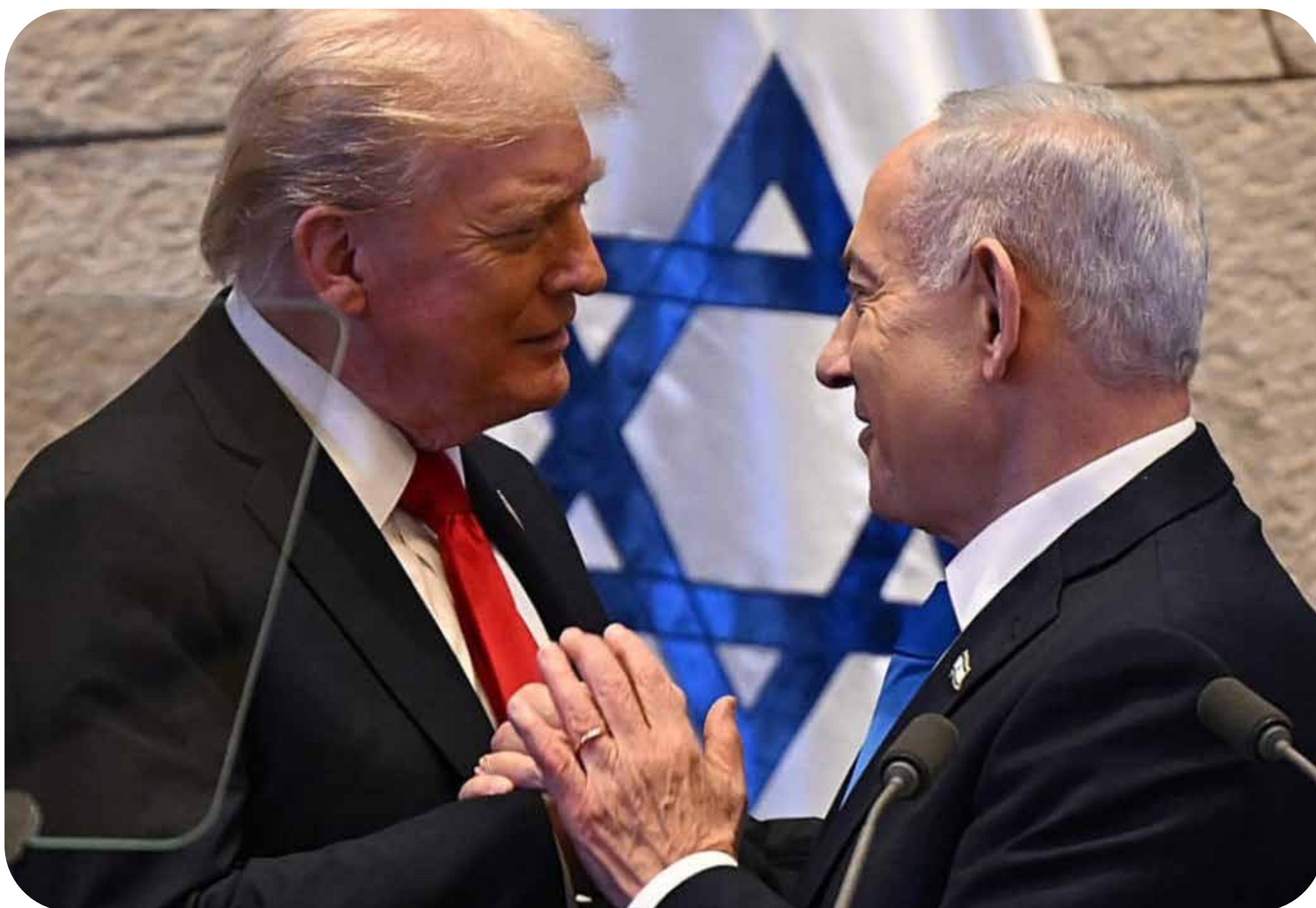
Trump e Netanyahu.

No dia 13 de outubro, o presidente estadunidense Donald Trump anunciou o fim da “guerra” no parlamento israelense. Em um discurso autoproclamatório e com muitos elogios ao criminoso de guerra Binyamin Netanyahu, Trump lembrou o alto-comando sionista que são os Estados Unidos que enviam as armas para Israel e, portanto, têm a palavra final. Além disso, Trump informou que retomará as negociações nucleares com o Irã.