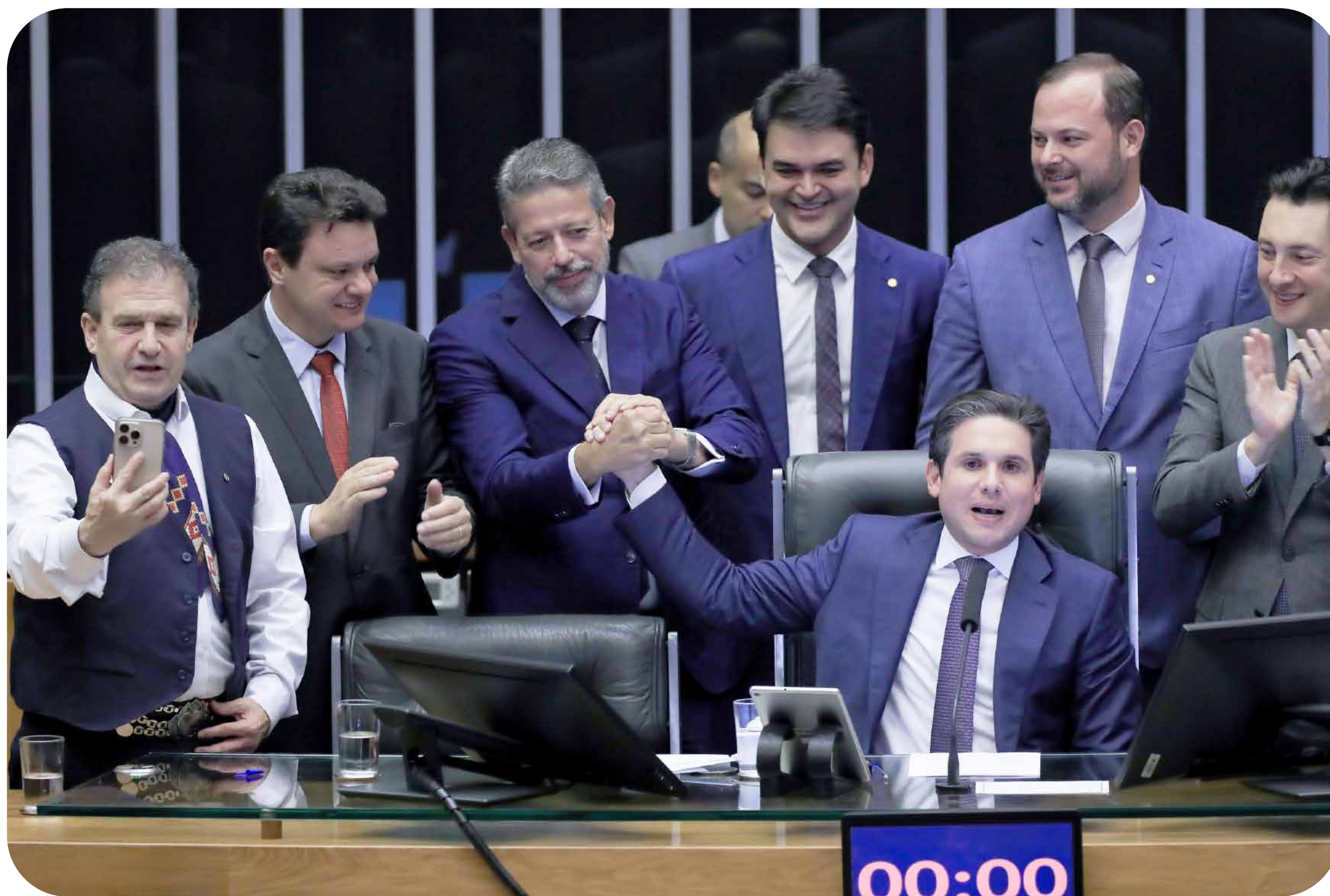
Sessão da Câmara dos Deputados para votar o isenção do IR.

A Câmara dos Deputados aprovou o projeto do Governo Federal que estende a isenção do Imposto de Renda (IR) para quem ganha até R$ 5 mil (hoje já é isento quem recebe até R$ 3.036). O projeto foi aprovado por unanimidade pelos 493 deputados presentes no plenário, da esquerda institucional até a extrema direita bolsonarista, passando pelo centrão.