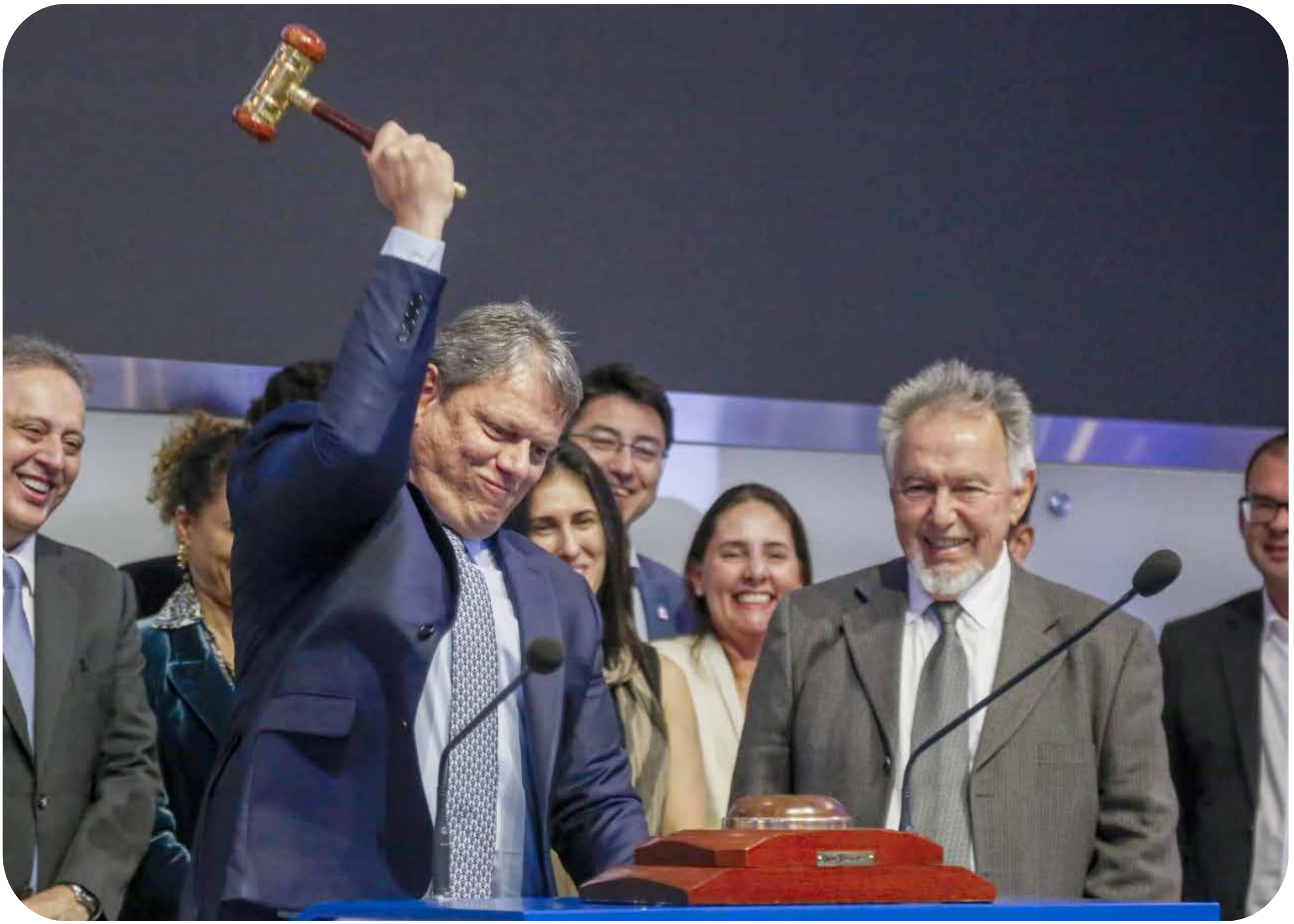
Tarcísio durante privatização da EMAE (Empresa Metropolitana de Águas e Energia)

Em meio às investigações, o governador de São Paulo, Tarcísio de Freitas, apressou-se em declarar que o PCC “não tem relação com o caso”. A fala, precipitada e sem base, foi menos um gesto de prudência e mais um movimento político.