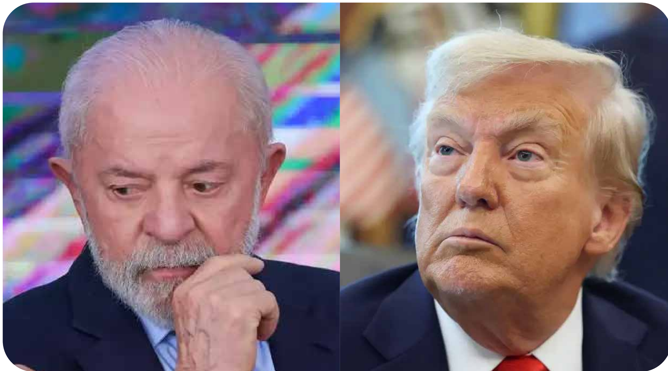
Lula e Trump.

Nestes tempos de convulsão política, econômica, social e ambiental, tem ficado cada vez mais evidente a impossibilidade de o capitalismo garantir uma vida digna para os trabalhadores.