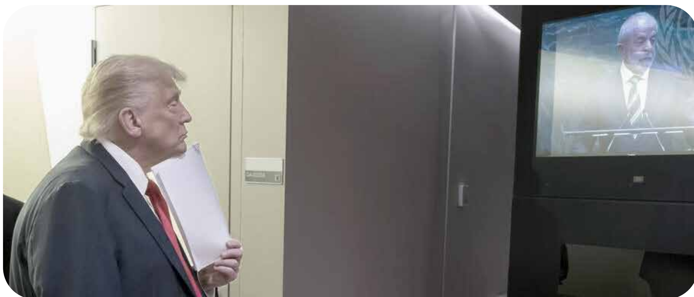
Presidente Donald Trump assiste ao discurso na ONU do Presidente Lula da Silva depois o elogia em discurso.

portanto, passa também pela luta contra o projeto capitalista e entreguista do governo Lula e da burguesia, como o arcabouço fiscal e pelo fim da escala 6×1. Por isso, só a organização e a mobilização independente da classe trabalhadora podem conquistar uma verdadeira independência e as reivindicações da nossa classe. ■