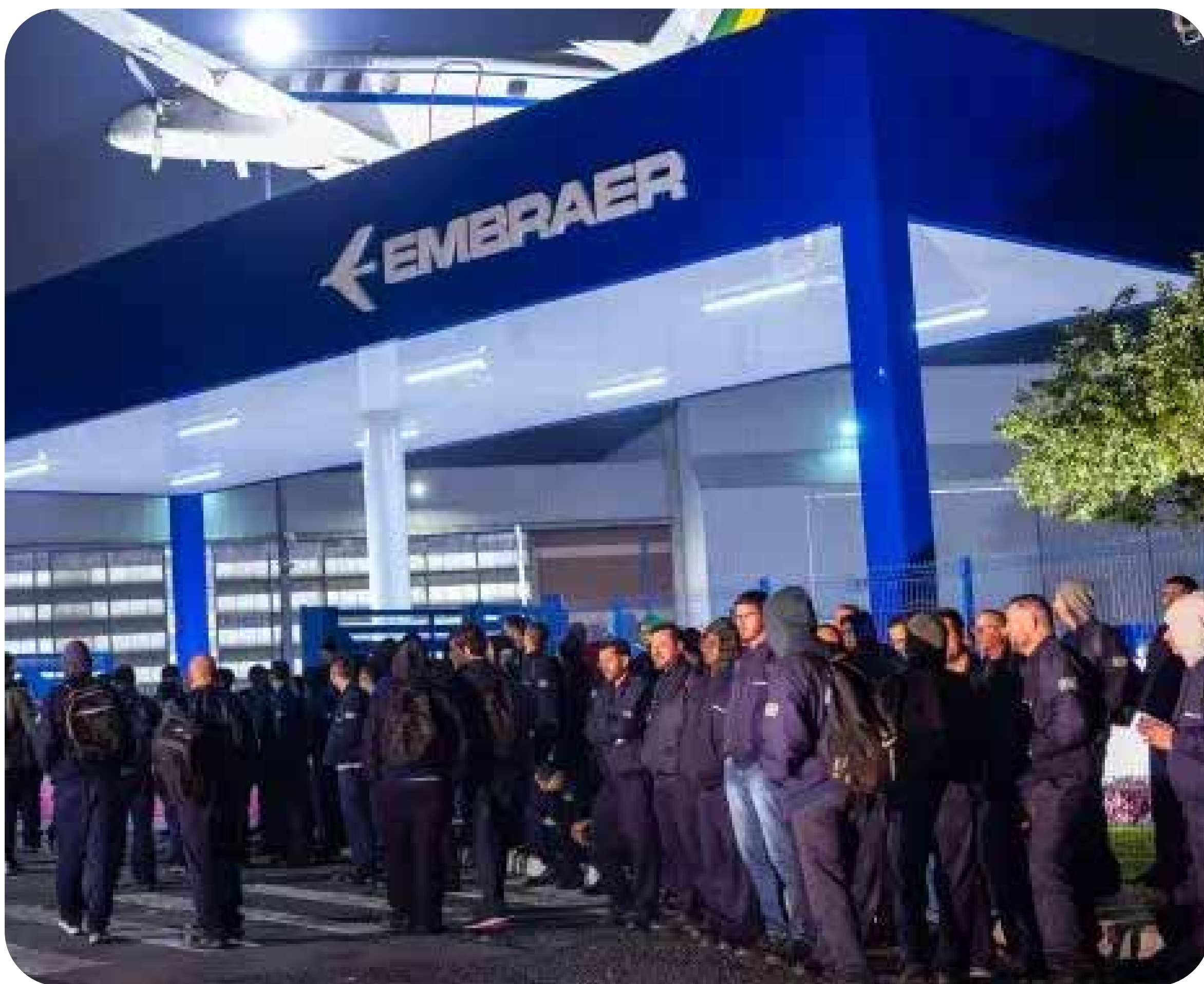
Greve Embraer

Em uma ação considerada intimidadora pelo Sindicato dos Metalúrgicos de São José dos Campos e Região, a Embraer acionou a Polícia Militar para conter a assembleia de trabalhadores em greve no último dia 18. Desde as 3h da madrugada, um forte aparato policial foi deslocado para o portão da fábrica.