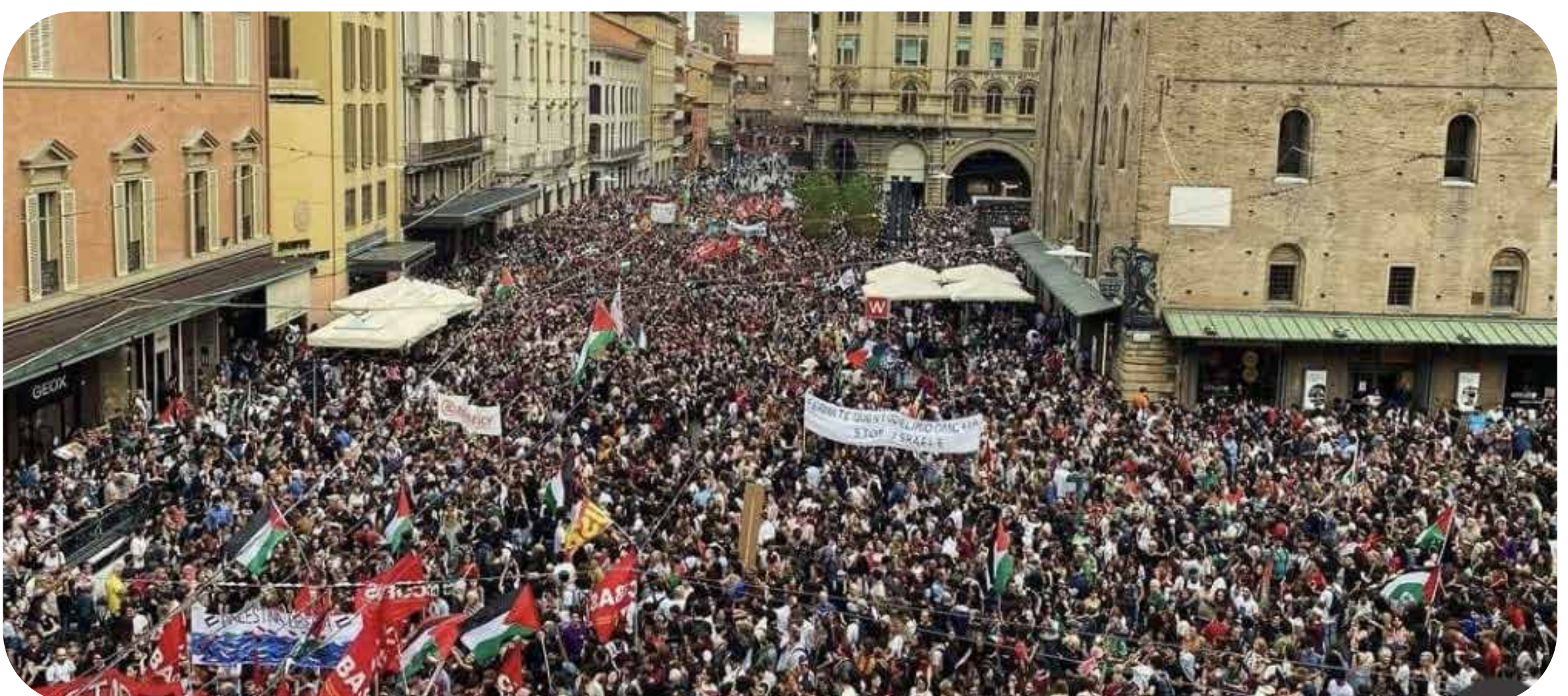
No dia 22, mais de 80 cidades italianas registraram atos e paralisações na Greve Geral pela Palestina

Entre ações exemplares da solidariedade, a ser seguida no Brasil, está a belíssima greve, acompanhada de protestos e bloqueios, protagonizada há poucos dias em cerca de 80 cidades da Itália.