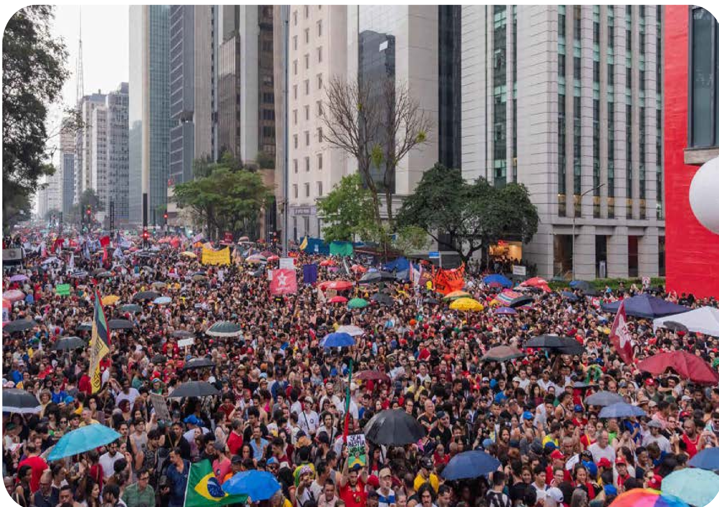
Manifestações em São Paulo contra a PEC da Bandidagem

No último dia 21, o país foi tomado por massivos protestos contra a PEC da Bandidagem e a anistia aos golpistas. Ruas e avenidas de todas as capitais e de pelo menos outras 33 cidades país afora receberam milhares de pessoas em protestos que superaram amplamente os atos de 7 de Setembro promovidos pelo bolsonarismo.