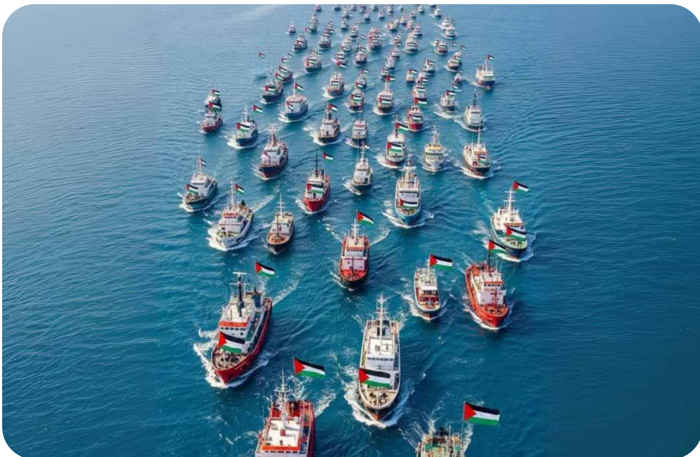
A maior Flotilha já organizada vai tentar romper bloqueio à Gaza