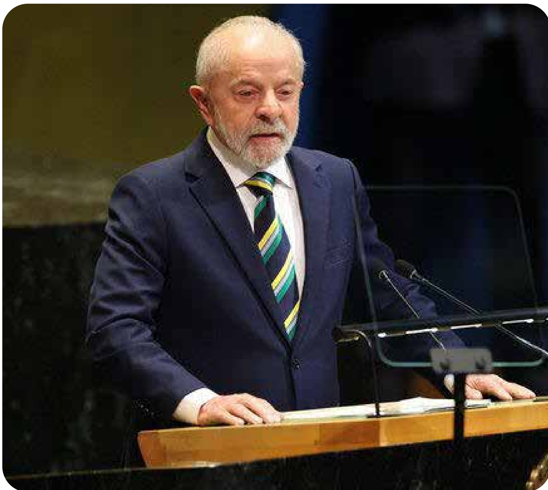
Lula discursa na Assembleia-Geral da ONU em 2025.

Na abertura da Assembleia Geral da ONU, Lula fez um discurso sobre defesa da soberania, contra o genocídio promovido pelo Estado de Israel, contra a ultradireita e de combate à pobreza. Mas, na prática, seu governo não toma medidas contra nenhuma dessas questões.