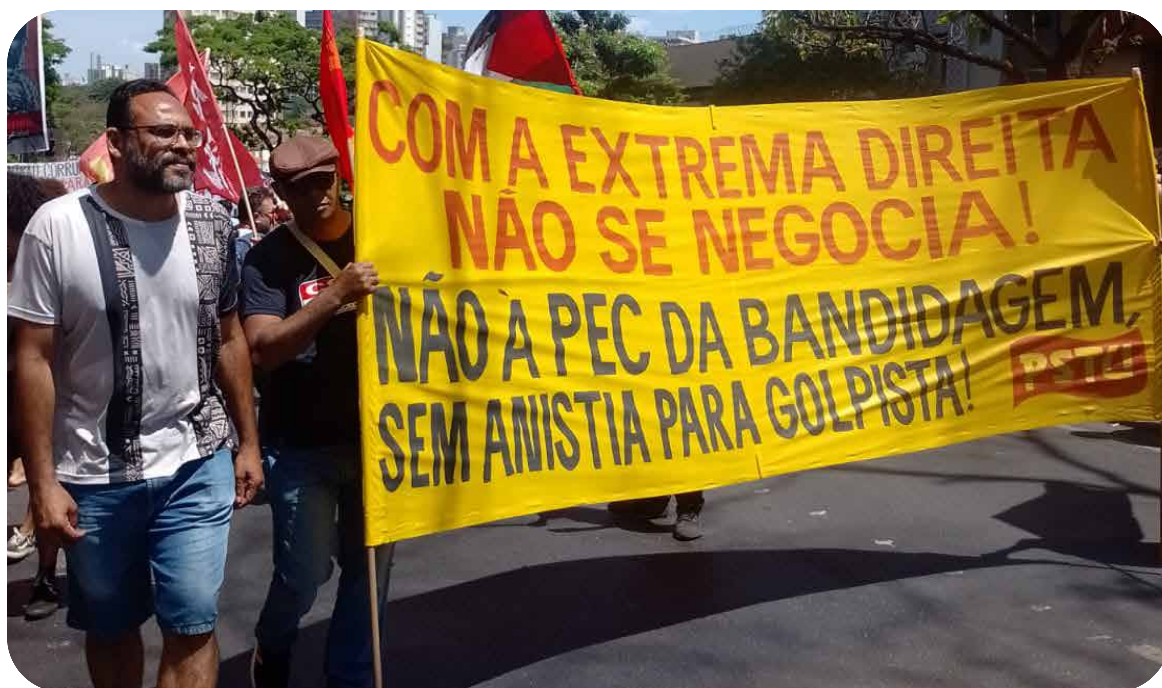
Manifestações em São Paulo contra a PEC da Bandidagem