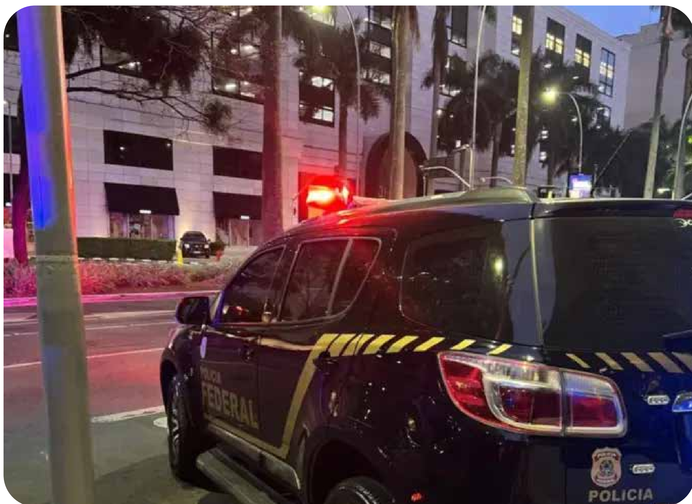
Operação policial na Faria Lima