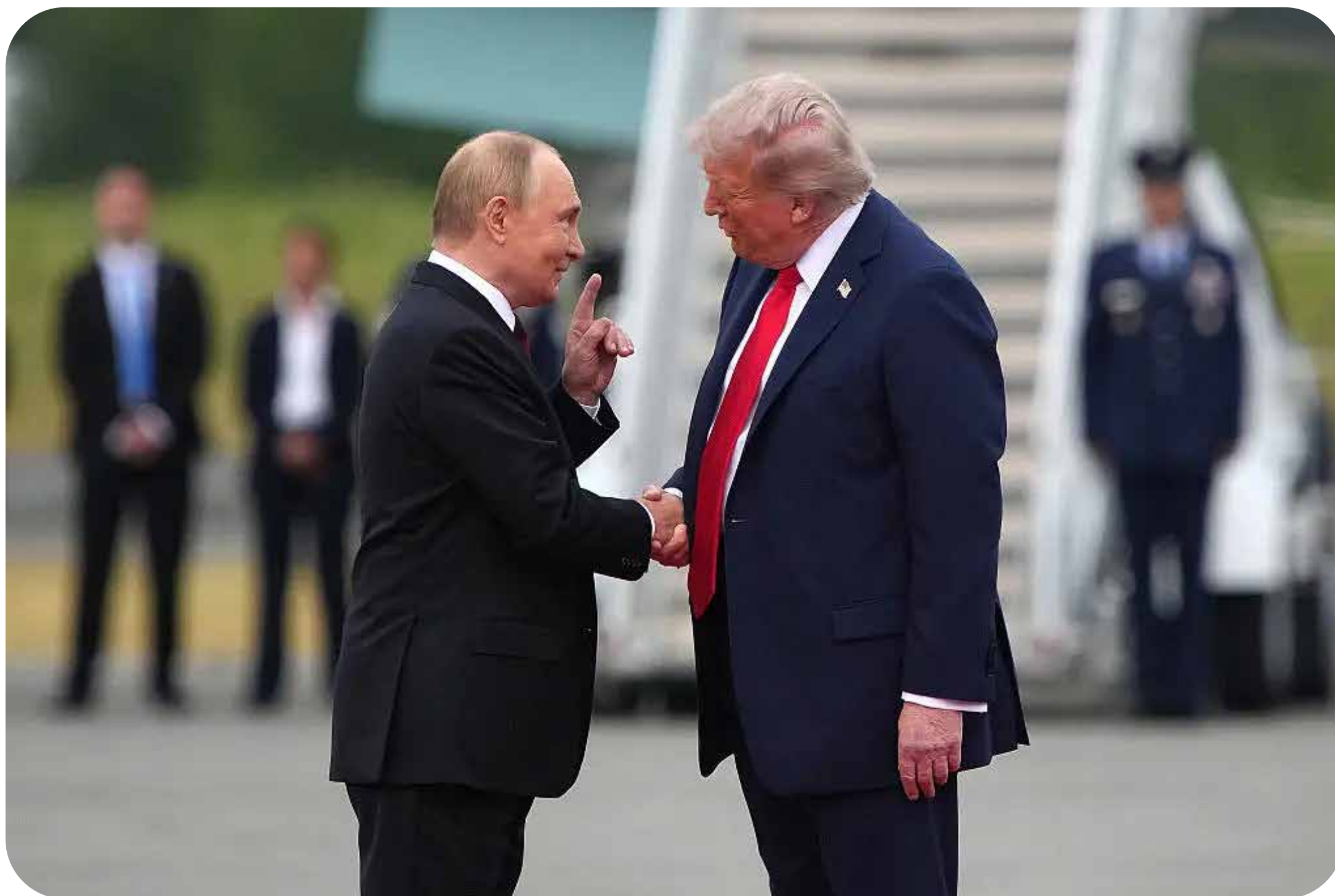
Presidente dos EUA, Donald Trump e o líder russo Vladimir Putin

Todos os imperialistas, de Trump a OTAN, passando pela União Europeia, empurram o governo ucraniano de Volodymyr Zelensky, de uma forma ou de outra, para uma capitulação diante da agressão de pilhagem que Vladimir Putin iniciou em 2014, com a anexação da Crimeia. No entanto, três anos e meio após a invasão russa, o povo ucraniano continua a dar demonstrações heroicas de resistência contra a divisão e a pilhagem que as potências forjam.