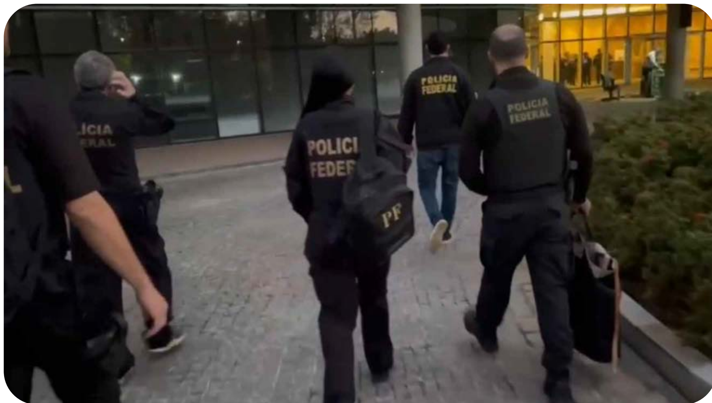
Operação policial na Faria Lima

No capitalismo, o lucro está acima de tudo. Não importa se ele vem da cana de açúcar, da cocaína ou de armas. Conseqüentemente, não existe uma fronteira absoluta entre as atividades legais e ilegais.