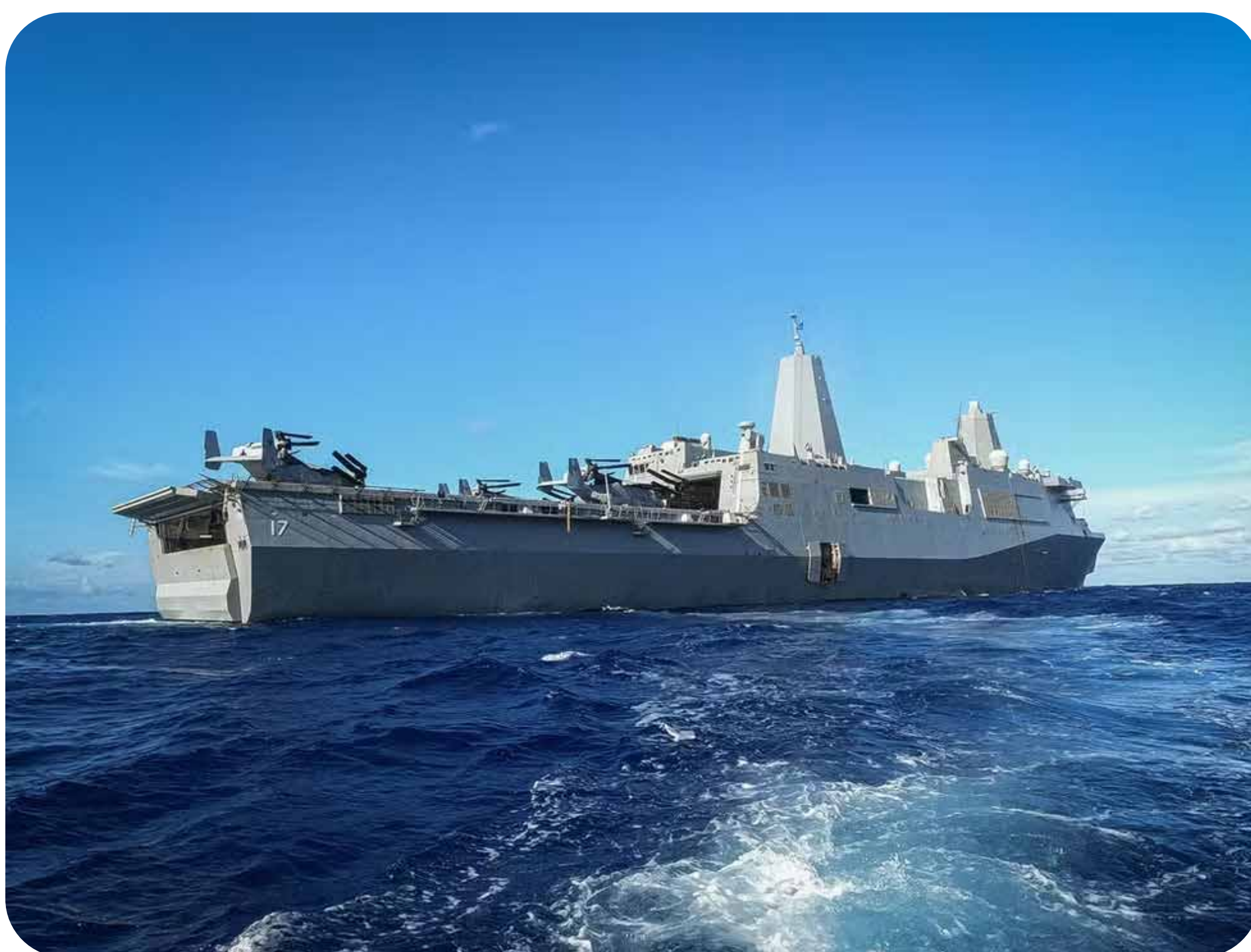
Navio anfíbio USS San Antonio, integrante do grupo de combate Iwo Jima da Marinha dos Estados Unidos