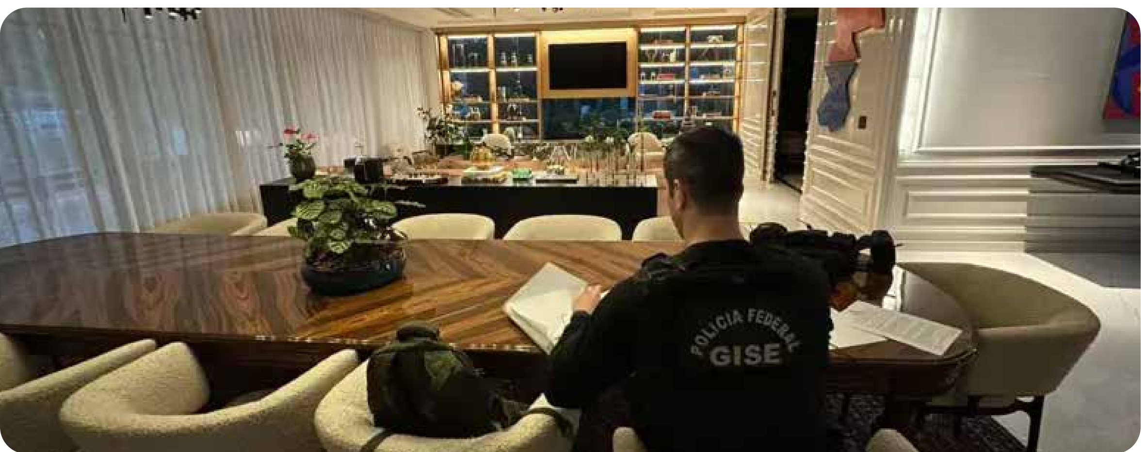
Operação policial na Faria Lima

O esquema na “Farinha” Lima mostra como é hipócrita a política de Segurança Pública. A PM de Tarcísio e Derrite participou da operação, mas não se tem notícia da “resistência seguida de morte”, tão comum nos bairros pobres.