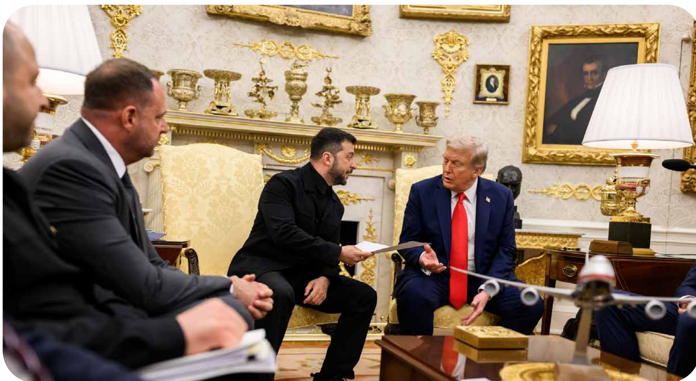
Presidente da Ucrânia, Zelensky, e dos EUA, Trump

Apoiamos a resistência da Ucrânia para derrotar os ocupantes. No entanto, denunciaremos seu regime oligárquico, o governo, o parlamento e Zelensky, como presidente da Ucrânia, por ser a correia de transmissão da dependência dos ditames imperialistas ocidentais. Ditames que minam cada vez mais a vontade das massas, que há 42 meses resistem e freiam a agressão do Kremlin.