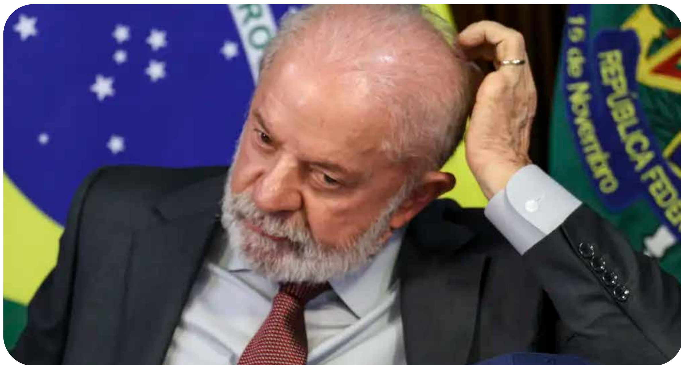
Presidente Lula durante reunião ministerial

Ao não tomar medidas contra Trump, governo Lula mantém submissão do país